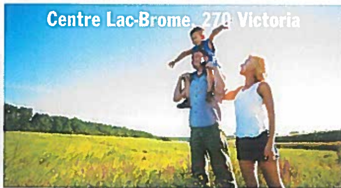
Centre Lac-Brome, 270 Victoria