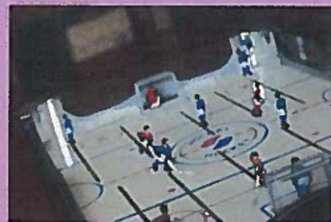
District 1217, a place for Teens. Just Teens.

Located in the Youth Room at the Centre Lac-Brome (park level), with two top-notch animators! Take advantage of four many games, such as: